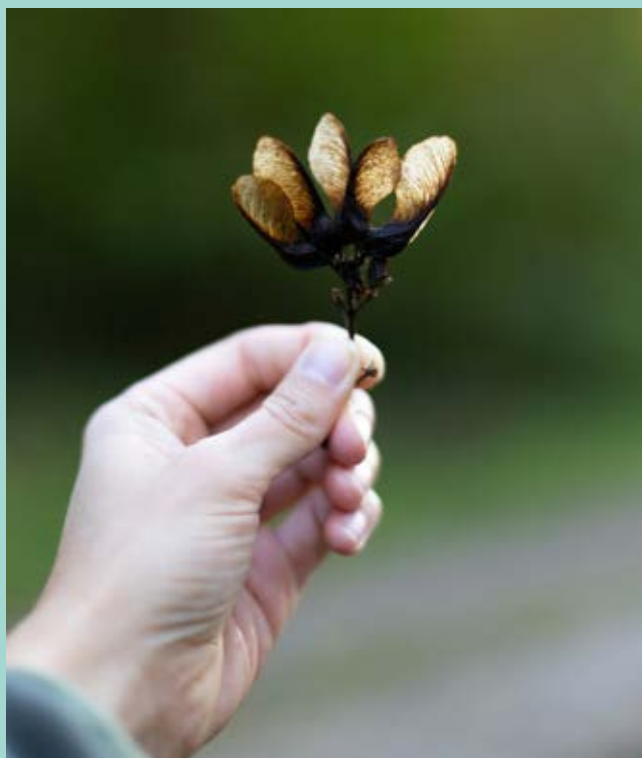
Ovan: Lönnäsa. Nedan: Vintergrön tall. Längst ner: Blommande syrén