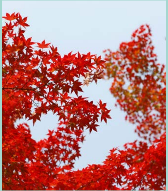
Ovan: Japansk lönn Nedan: Avenbok