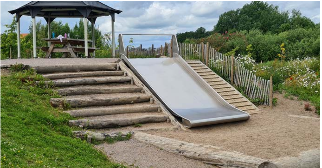
Ovan: Lekredskap som nyttjar topografin.

hinderbana, terrasseringar eller vattenlek. Även väldigt små topografiska skillnader kan vara av värde, till exempel att kunna rulla över nivåskillnader med rullstol, gäststol eller andra hjälpmedel.