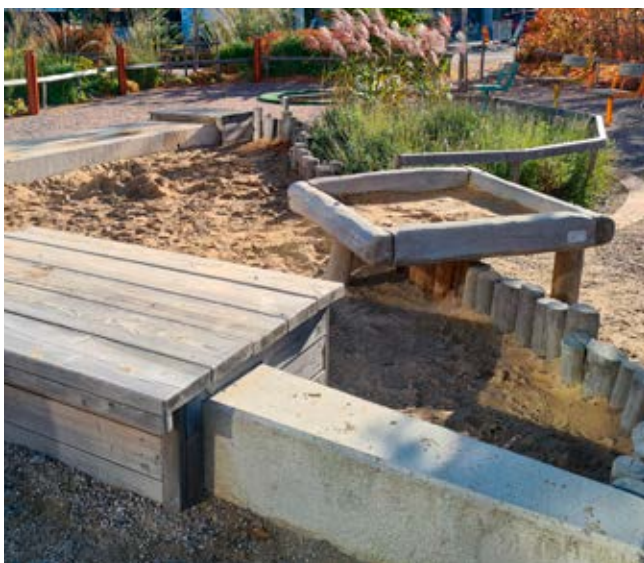
Del av sandlandskap med bakkbord som tillgängliggör leken för fler.

Våra skol-och förskolegårdar ska utformas för att alla barn ska kunna delta i lek och rörelse och få möjlighet till återhämtning utifrån sina förutsättningar och behov. Miljön behöver utformas för att ta hänsyn till olika behov av att vara social, olika förmåga att hitta fokus, se, höra och röra sig.