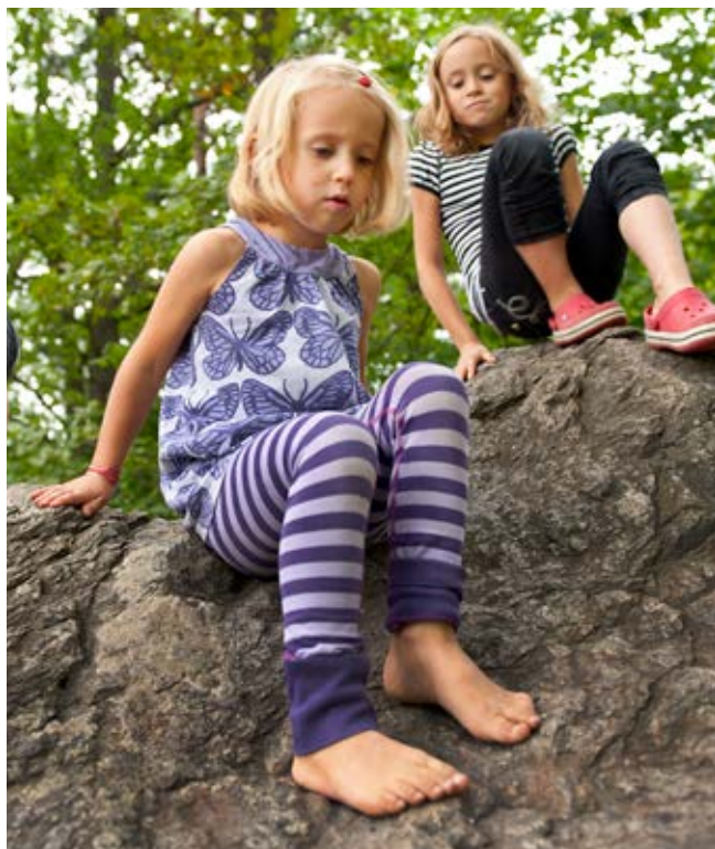
En bevarad berghäll eller en kulle med stockar, stenar och stubbar erbjuder både motorisk lek och en plats att samlas på.

Gården ska ha en topografisk variation som utmanar barnen motoriskt och skapar möjligheter till lek och rörelse, det vill säga att barnens aktiviteter nyttjar och tar till vara topografin. Den ska vara fysiskt tillgänglig på så många platser och områden som är möjligt, utifrån miljöns förutsättningar.