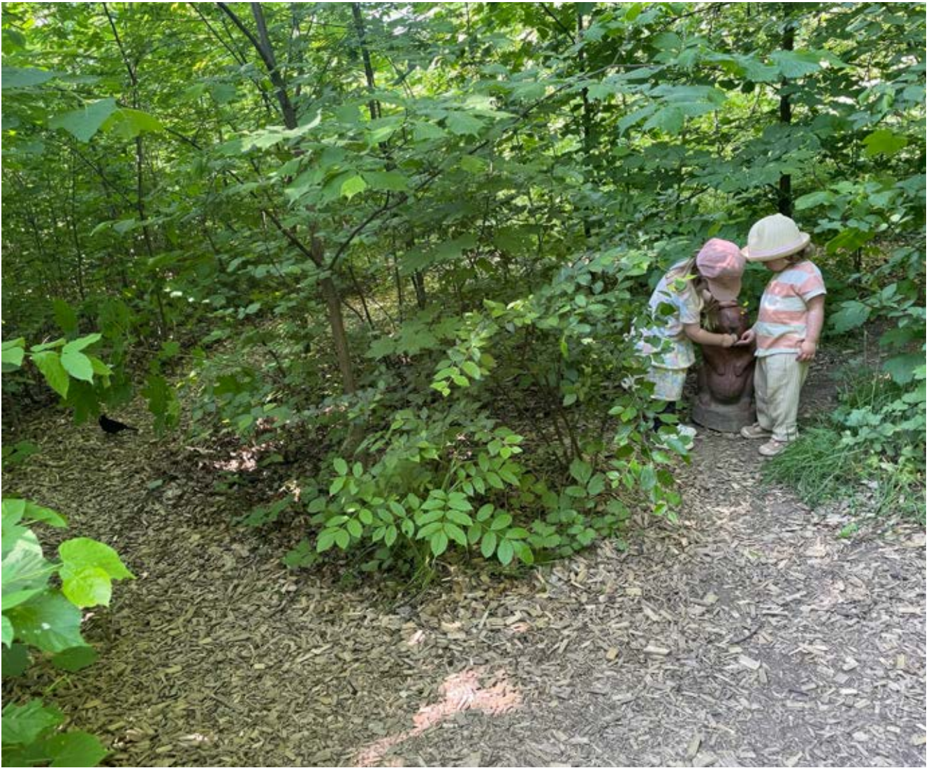
Vildvuxna partier är lämpliga för reträtt.

Reträttplatser är platser där barn kan varva ner, dra sig undan och har möjlighet att skapa sin egen värld. Platsen ska vara en kontrast till en intensiv inomhusmiljö, och ge möjlighet till vila, att tränga sig in i ett utrymme och vara omsluten. Reträttplatserna kan med fördel skyltas som en ”paus-plats” så det blir tydligt för alla barn och unga vad som gäller på de platserna, tydligheten gynnar särskilt barn med neuropsykiatrisk funktionsnedsättning. Platserna ska finnas i flera av gårdens zoner och präglas av grönska och material som barnen kan göra avtryck på. I den trygga zonen kan en reträttplats finnas på en veranda vid entrén nära personalens ankarplats. I den aktiva zonen kan reträttplatsen vara i ett buskage eller vid lekhus. I den vilda zonen är vildvuxna partier lämpliga för reträtt där barnen kan skapa kojor med mera. Vad en reträttplats innebär är olika för olika barn. Möjlighet till fantasilek och upplevelse av grönska, naturväxlingar, utblickar/ utsikt och att pyssla om något är exempel på nedvarvning för barn.