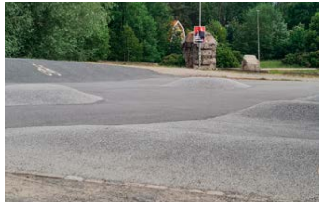
Ovan och nedan: På en från början platt yta kan ett topografiskt landskap konstrueras för lek.

Öppna och plana ytor ska finnas i flera av gårdens zoner. Här ska det vara möjligt att utföra olika aktiviteter som att uppföra tillfälliga byggkonstruktioner och att få upp fart i spring och lek. Plana ytor kan vara av olika material och kan med detaljerad gestaltning och medveten höjdsättning höja lekvärdena på gården. De kan vara av olika material; asfalterade, belagda med marksten eller stenhjul. Viktiga stråk ska kunna skottas vintertid, och på minst ett ställe bör det vara möjligt att placera snö i högar.