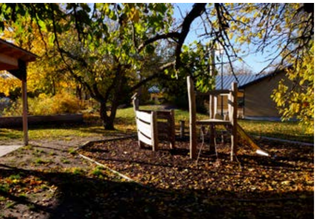
Vandrande skugga ger förutsättning för lek olika årstider och vid olika väder.