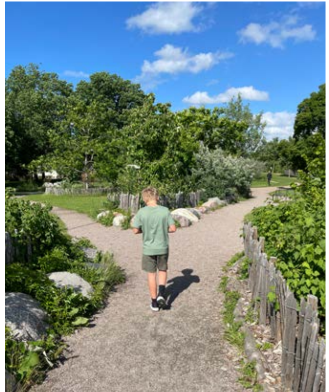
Ovan: Instängslad grönska med gångar emellan ger växterna möjlighet att etablera sig. Nedan: Spänger samlar barnspring så att grönskan kan etablera sig och jorden ej kompakteras.

Buskar av olika storlekar, perenner, marktäckare, örter och lökar bidrar till variation och helhet.