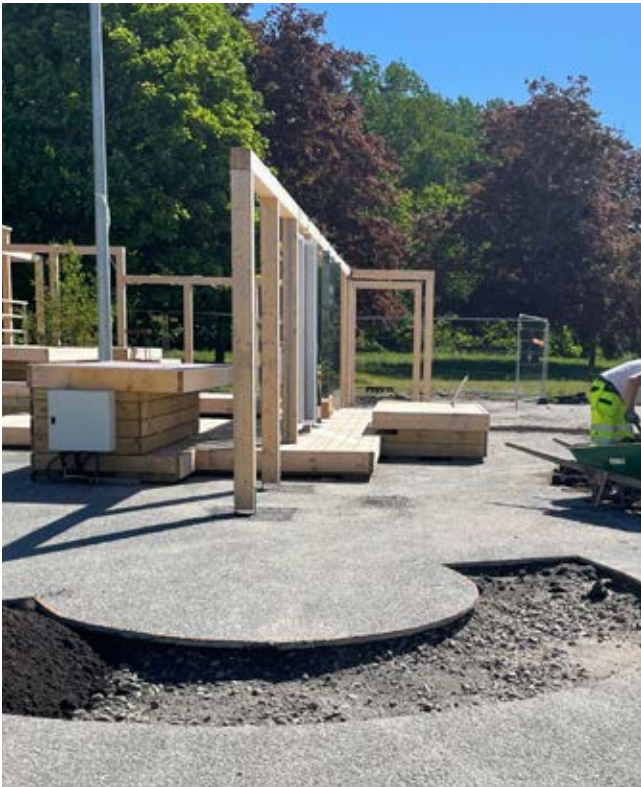
Asfalt som brutits upp i fantasifulla mönster i samråd med barnen gör plats för grönska.