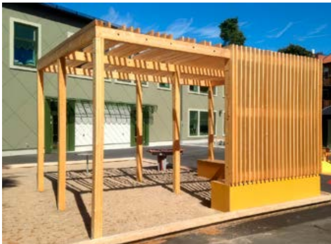
Pergolor är viktiga komplement till lövskugga.