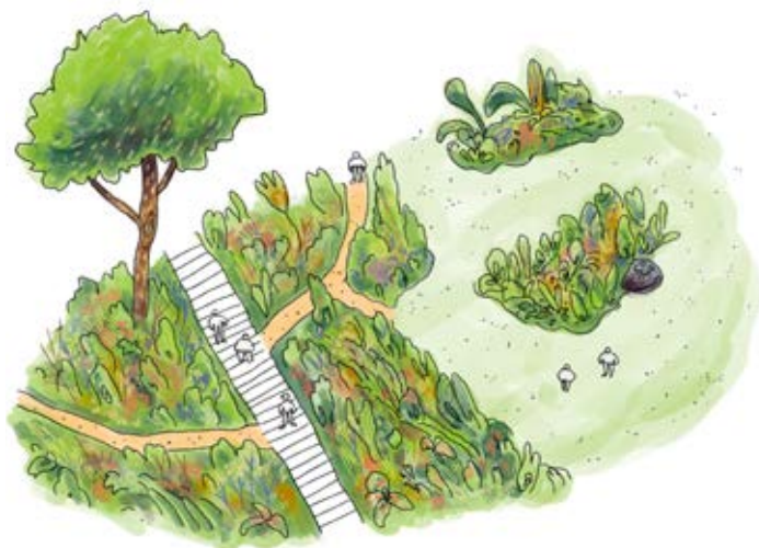
Stigar och spänger

För att åstadkomma grönnare gårdar finns det i huvudsak tre olika strategier att tillämpa. Syftet är att skapa goda förutsättningar för barnens vistelse och för vegetationens etablering. Genom att skapa slingor, gångar och passager genom eller runt vegetationen tillgängliggörs grönskan för barnen. Barnen kan omslutas av grönska och få tillgång till taktila värden så som doft, smak och känsel, inte bara när man vistas i grönskan, utan också i de tillgängliga mellanrummen.