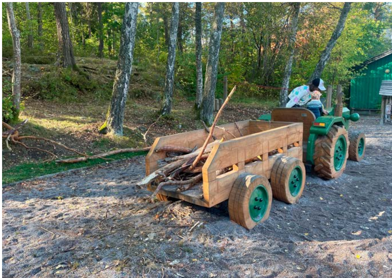
Lövsugga bidrar till en god miljö för barn att vistas i.