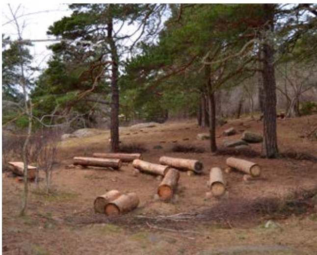
Samlingsplatser under träd ger möjlighet till undervisning i skugga.

För att uppnå ett gott lokalklimat behöver barnens lek och den pedagogiska verksamheten kunna ske i både sol och skugga.