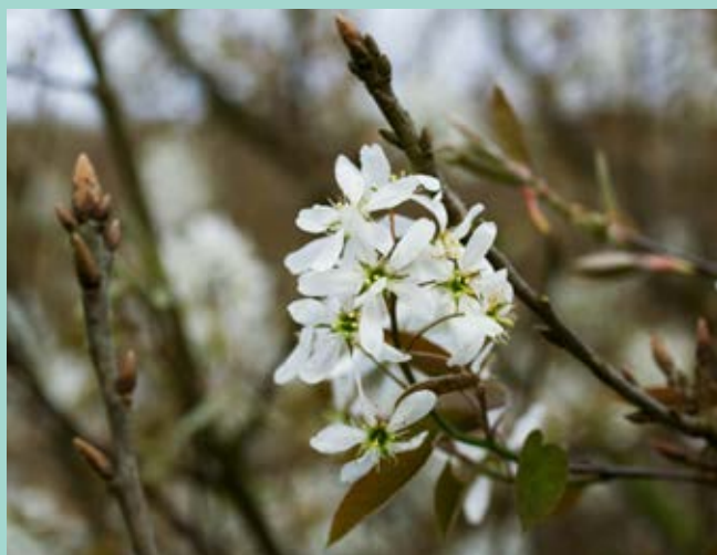
Ovan: Häggmispel. Nedan: Sälg