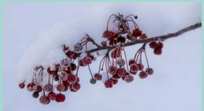
Ovan: Rönnbär. Nedan: Vintergäck