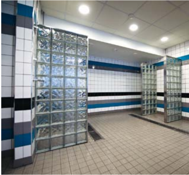
Det nyrenoverade duschrummet känns ljust och fräscht.